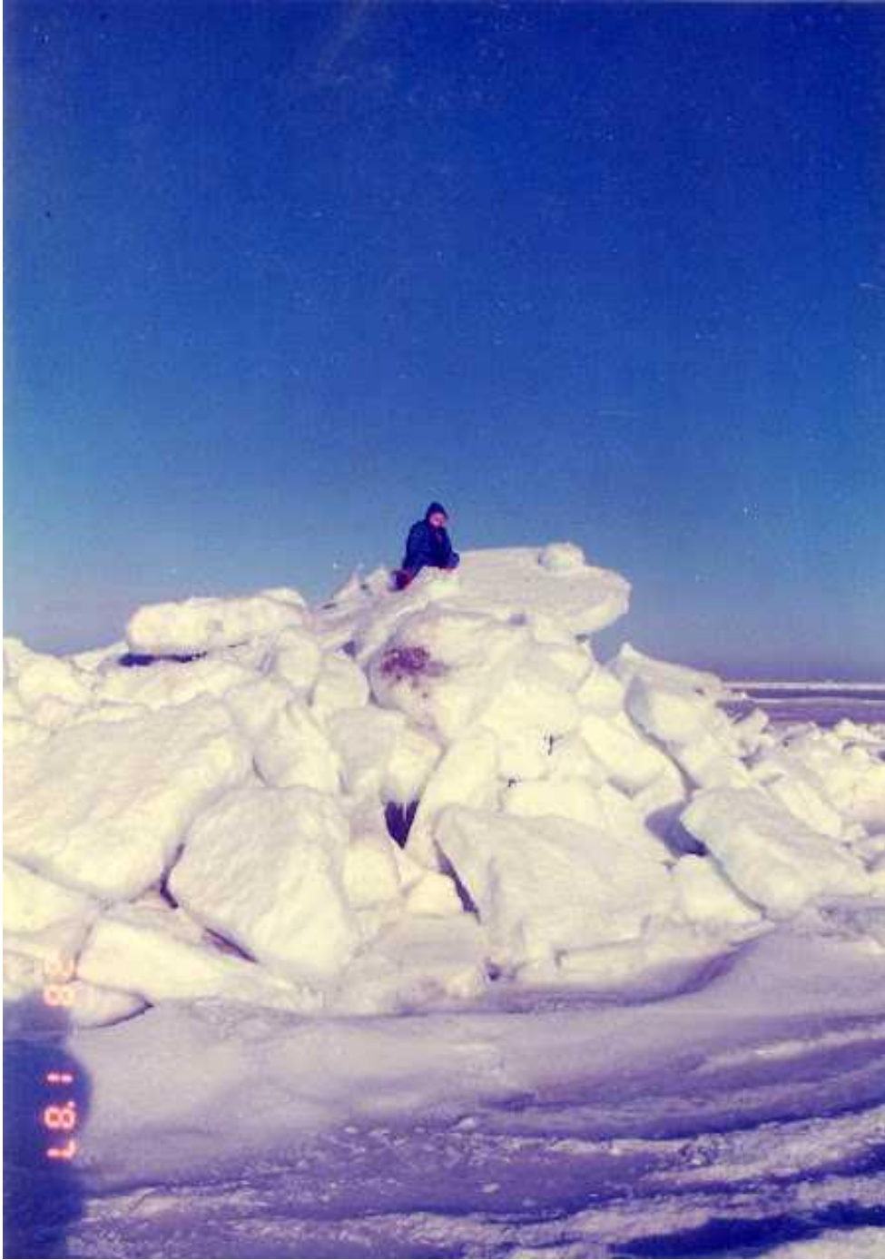
1987, minus 24 C, isskruninger på stranden.